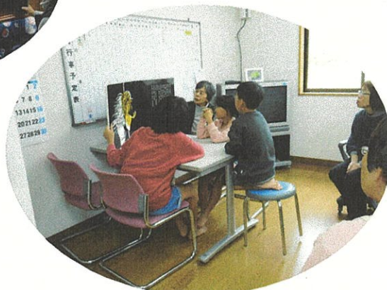
絵本を読んで聞いてもらいました～