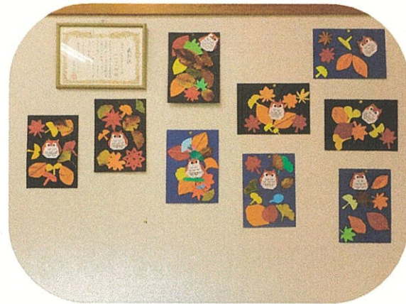
ふくろうと紅葉を折り紙で作りました