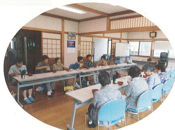
ひまわり教室のみなさんと昼食♪