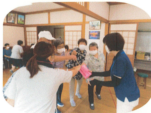
6チームをくじ引きで順番決め☆