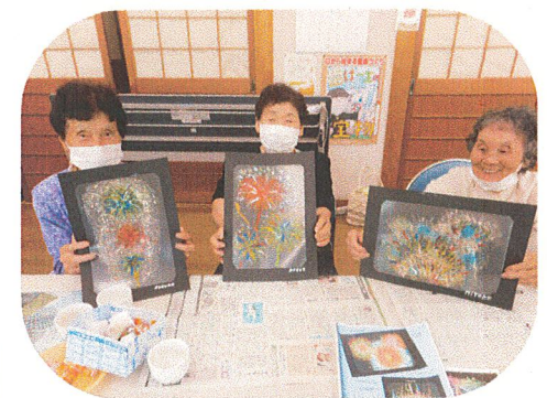
絵の具で水彩画アート☆ 素敵な花火の出来上がり