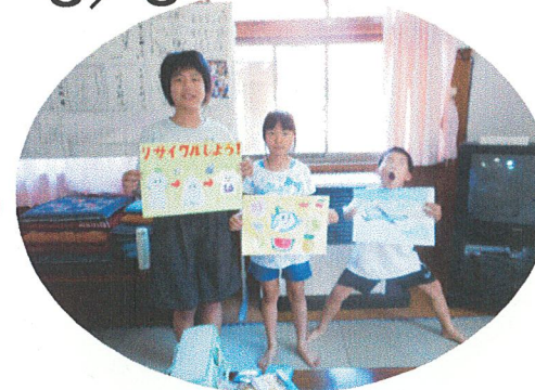
夏休みの宿題の絵を描きました♪