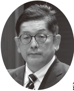
日本共産党 鏗 史朗 議員