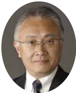
椿原 正洋 議員