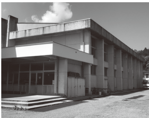
(写真: 鳳至小学校体育館)