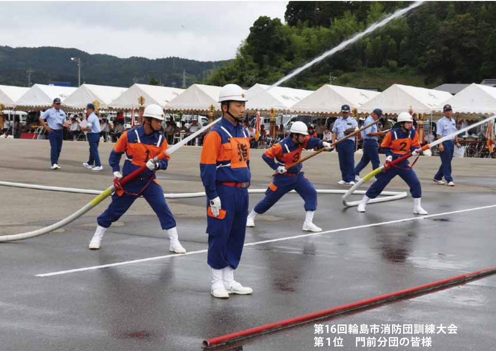
第16回輪島市消防団訓練大会 第1位 門前分団の皆様