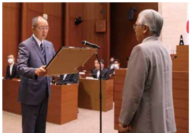
表彰状を受けとる椿原議員(左)と大宮副議長(右)