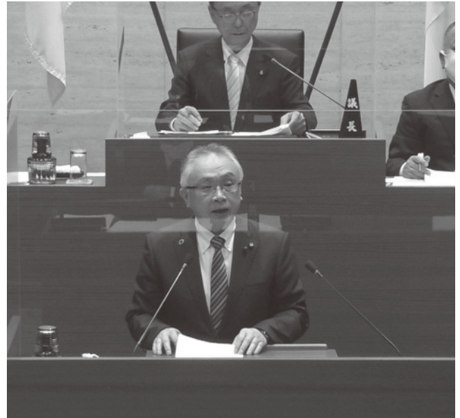
登壇し質疑を行う椿原議員