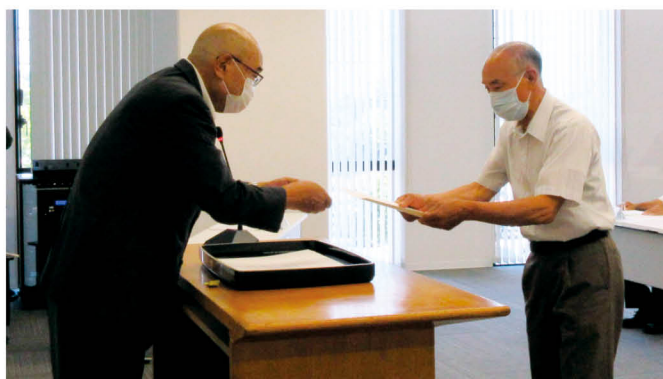
農業委員辞令交付式 梶市長(左) 農業委員(右)

なお、今回選ばれた農業委員及び農地利用最適化推進委員の任期は、令和六年七月三十一日までとなります。