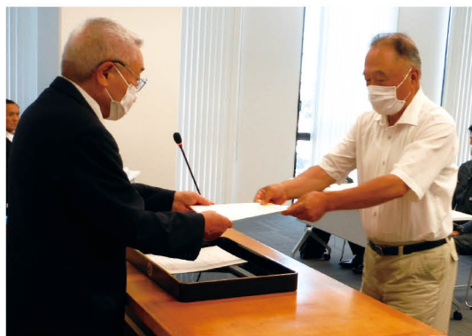
農地利用最適化推進委員 委嘱状交付式 田上会長(左) 推進委員(右)