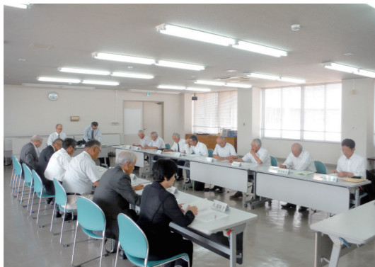
臨時総会 会長・会長職務代理の互選

平成二十八年四月一日より、農業委員会等に関する法律が改正され、今回の改選から農業委員会は新たな体制へと移行しました。 農業委員十五名が市議会の同意を得て、平成三十年八月二日に市長より任命されました。 次いで農地利用最適化推進委員十五名の委嘱が田上会長より行われ、総勢三十名の新しい体制での輪島市農業委員会が発足しました。