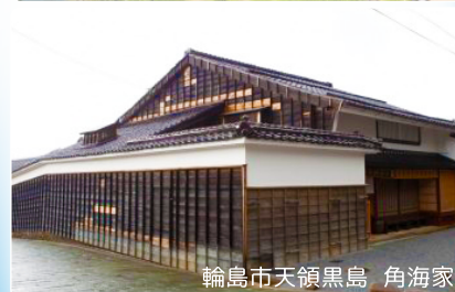
輪島市天領黒島 角海家